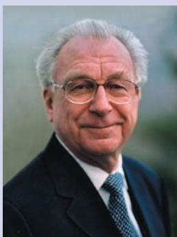
Prof. Dr. h.c. Lothar Späth Ministerpräsident a.D., Leonberg